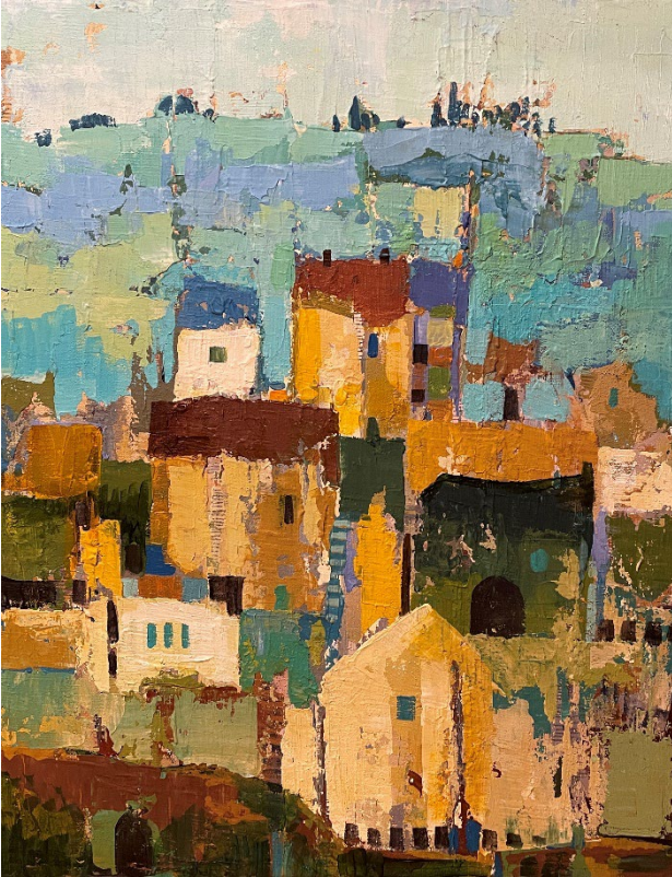
Birthe Kjærsgaard, Løgstør – Billedkunst